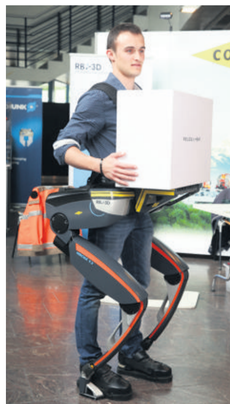
L'exosquelette conçu par RB3D pour l'entreprise Colas Suisse.