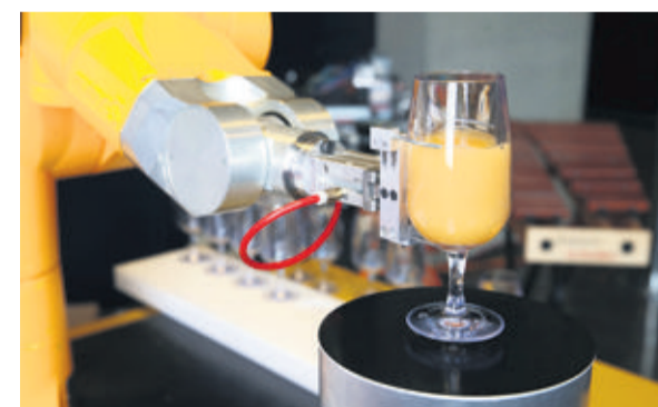
Le robot à cocktails, détournement ludique d'une machine conçue pour l'entreprise Contexa.